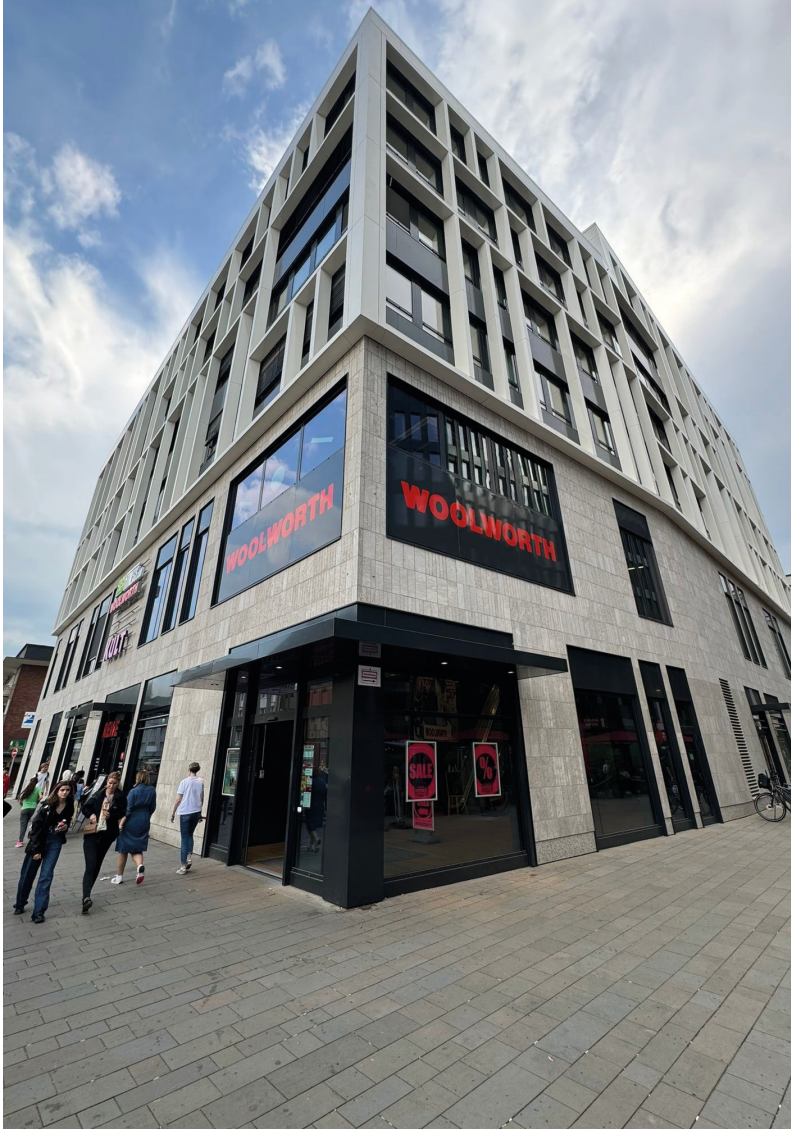
Husemann Karree Bochum WESTERTOR Lübbecke