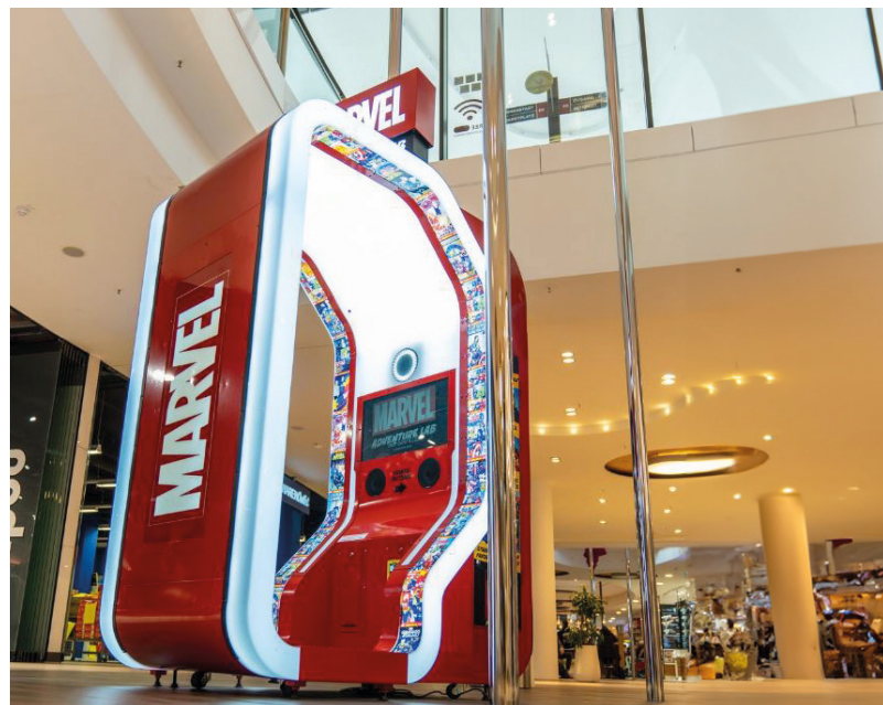
Coffee-Bike Rathaus Galerie Essen Marvel Booth Forum Hanau Roco the Roller Coaster Constructor