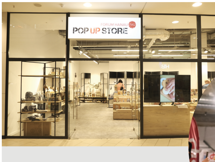
Pop-Up-Store Forum Hanau Tatkraft