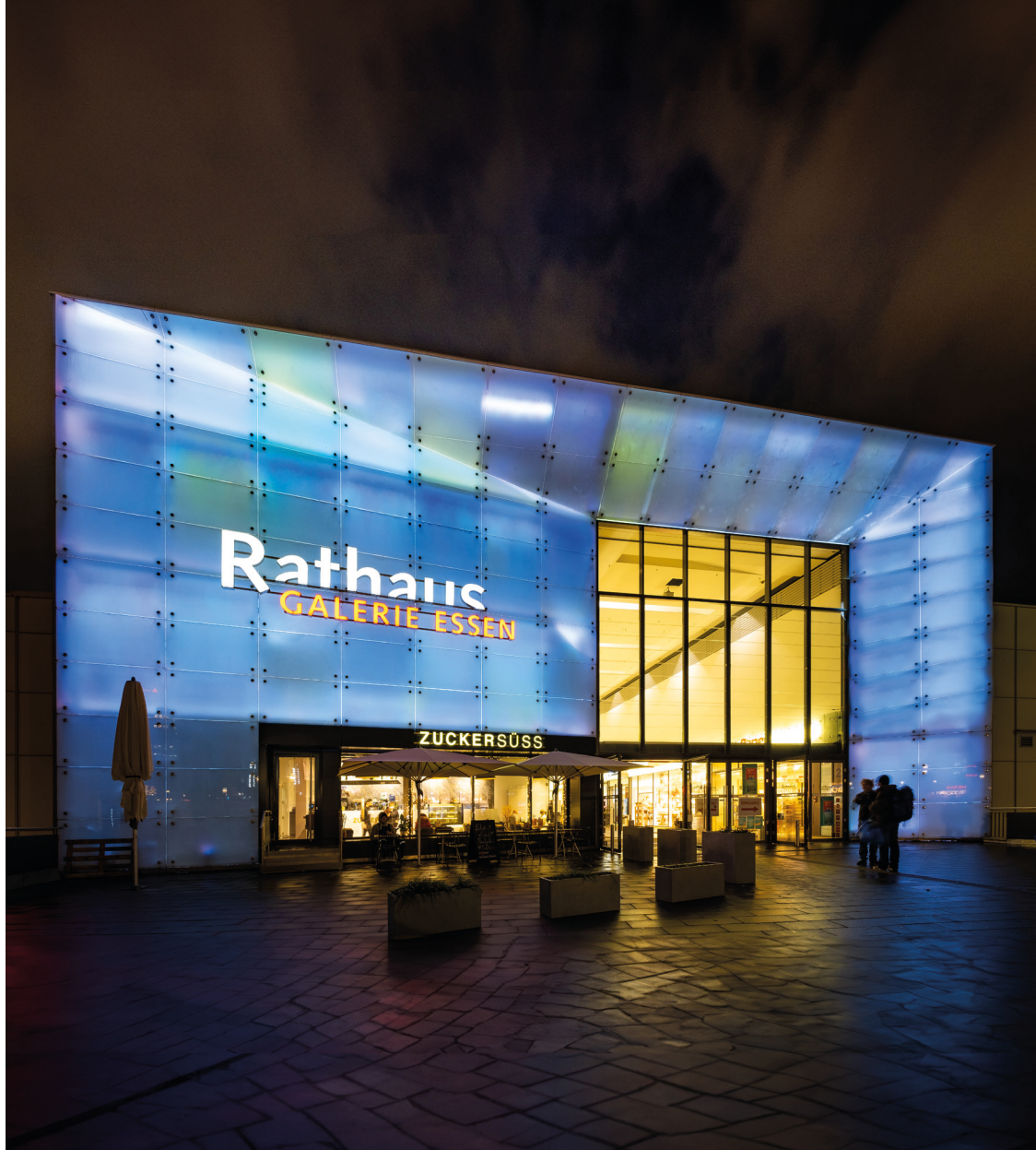
Rathaus Galerie Essen