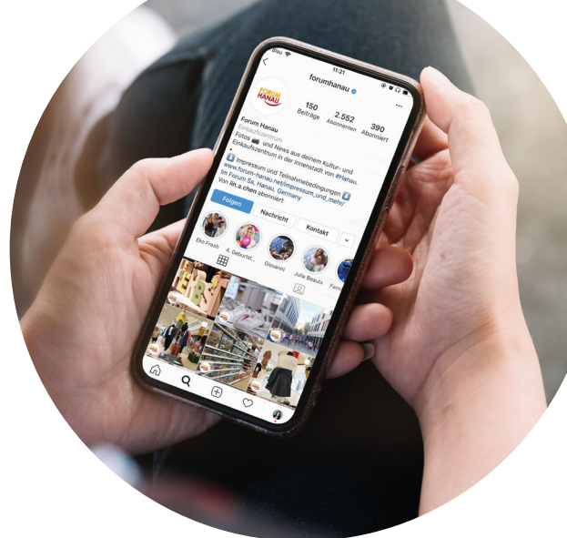
Social-Media-Account Forum Hanau PhotoBooth FORUM Schwanthalerhöhe Burgplatz Sommer (mit der Stadt Leipzig) Petersbogen Leipzig

Unsere CentermanagerInnen und das gesamte Team kümmern sich um jeden einzelnen Aspekt der Shopping Places und stehen den MieterInnen, den EigentümerInnen sowie DienstleisterInnen und KundInnen als engagierte AnsprechpartnerInnen jederzeit zur Verfügung . Sie agieren hierbei immer mit Blick auf die Kosten und im Sinne der Nachhaltigkeit, um eine langfristige positive Entwicklung der Shopping Places zu gewährleisten.